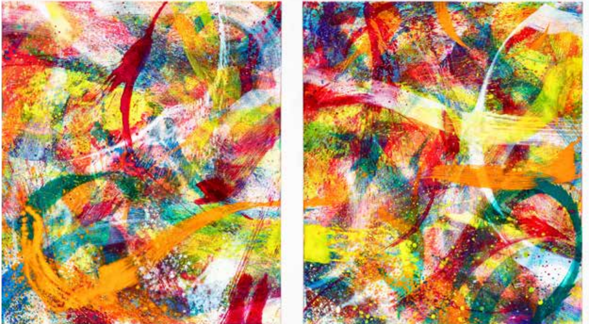
Strange Loops DUO: Linie, 2016, Öl auf Leinwand, Diptychon 140cm x 240cm

Die aktuellen, charakteristisch transparenten Gemälde von Helga Mols sind wahre Farb-Eruptionen. Durch zahllose Schichtungen von Mal-Gesten entstehen farbige Sedimente, die eine starke Dichte erreichen, so dass das Auge des Betrachters den malerischen Prozess nicht mehr nachvollziehen kann. Die Gemälde scheinen aus reiner Bewegung zu bestehen und vermitteln eine hohe Energie, die den Betrachter förmlich in die Bildoberfläche hineinzieht. Was zunächst rein gestisch anmutet folgt einer spezifischen Idee, aus der sich der Titel herleitet.