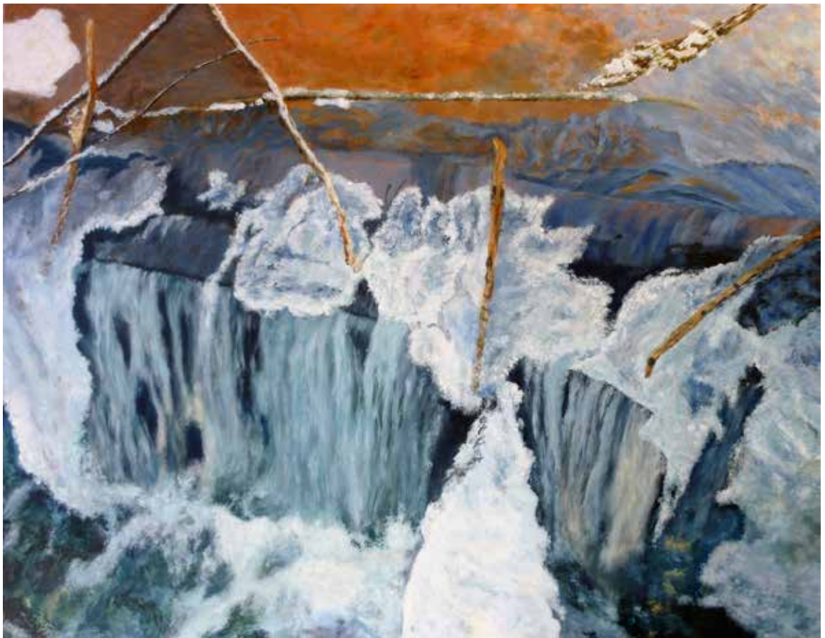
Aus der Serie Eis: Eis 1, 2017, Acryl auf Leinwand, 90 x 70 cm

Sie führen zu kraftvollen und meditativen Impressionen der Darstellungen dieser Winterlandschaften.