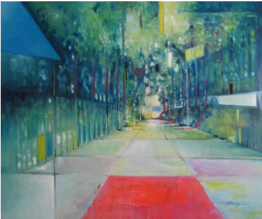
Die Wege, 2016, Öl/Acryl auf Leinwand, 100 cm x 120 cm

Ich sehe in meiner Arbeit eine Zusammenfassung der Welt in Linien, Farben, Natur, Perspektiven. Grundsätzlich ist der Versuch die Freiheit, repräsentiert durch die Natur, und die Regel des alltäglichen Lebens, repräsentiert durch geometrische Formen, in Verbindung zu bringen und damit eine Harmonie zu erreichen.