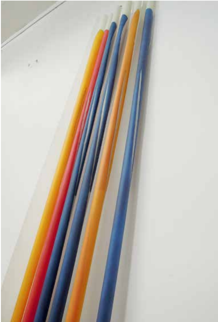
Dritte Haut, 2016/1017, Tusche auf polyester- beschichtetem Transparentpapier, 6-teilig, Durchmesser ca.15cm, Höhe 206cm

Seit 2012 thematisiert Daphna Koll Frauenkleider als Projektionsfläche. Dabei bedient sie sich in besonderer Weise der Erscheinungsoberflächen im Dialog mit der Dynamik von Papier und Primärfarben + Schwarz. Zwei Werkgruppen – Portrait / „Selbstportrait“ und „Dritte Haut“, die in einem entwicklungsbedingten Zusammenhang entstanden sind, werden in dieser Werkschau gezeigt.