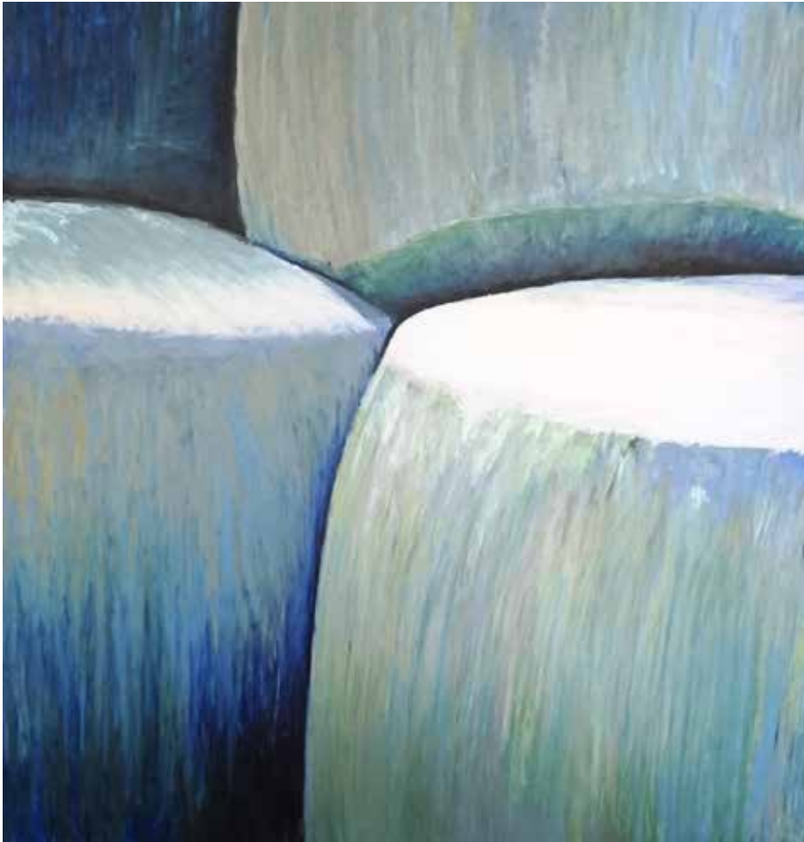
Gebalt 03 , 2016, Ölkreiden auf Kappaplatte, 150 cm x 140 cm

Meine Arbeiten sind in Schichten angelegt. Wachs- und Ölkreiden in verschiedenen Farben werden übereinander aufgetragen und entfalten durch transparente, halbtransparente und deckende Anteile ihre Wirkung. In der Serie „gebalt“ schieben sich gestapelte Formen in die Dreidimensionalität.