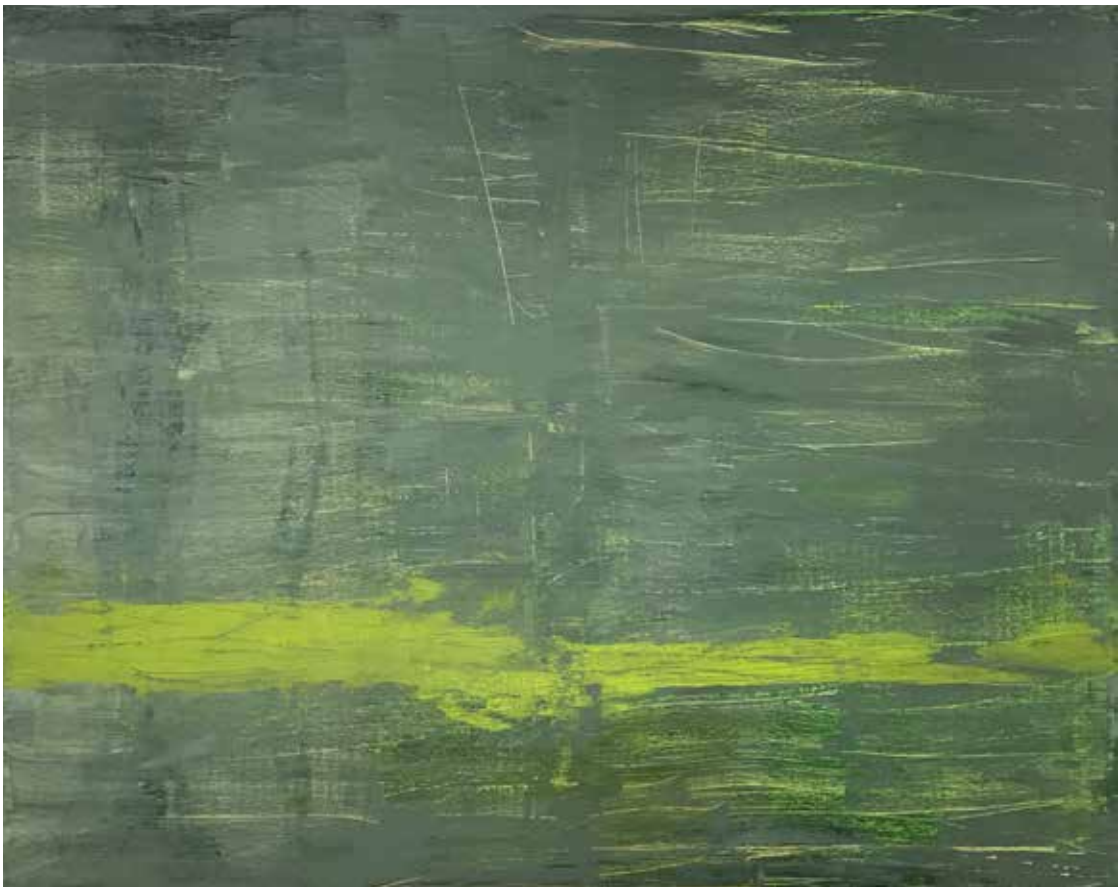
Island II, Öl/Leinwand, 80 cm x 100 cm

Zentrales Thema der abstrakten Arbeiten ist das Medium Farbe, das mal lasierend, mal in Schichten aufgetragen, ein Eigenleben entfaltet und sich aus den zweidimensionalen Malgründen zu einem Farbraum erweitert. Eine Reise ins isländische Hochland war Inspiration zu den hier gezeigten Arbeiten zur Farbe GRÜN.