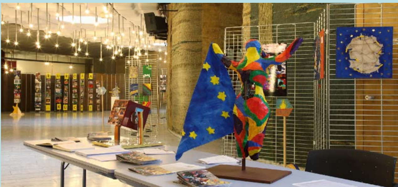
Aufnahmen aus der Ausstellung im Europaparlament in Straßburg vom März 2009

Weitere Infos unter www.erfahrung-europa.de