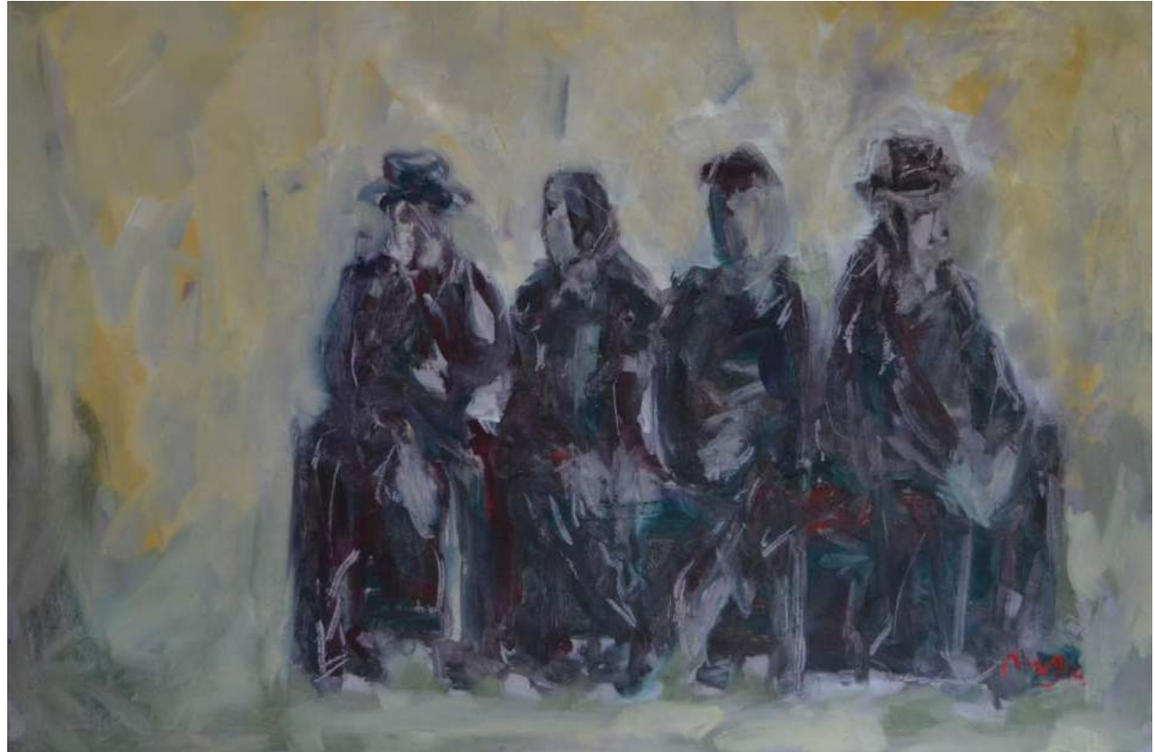
"UNTERHALTUNG", 2016. 80 X100 cm Öl,