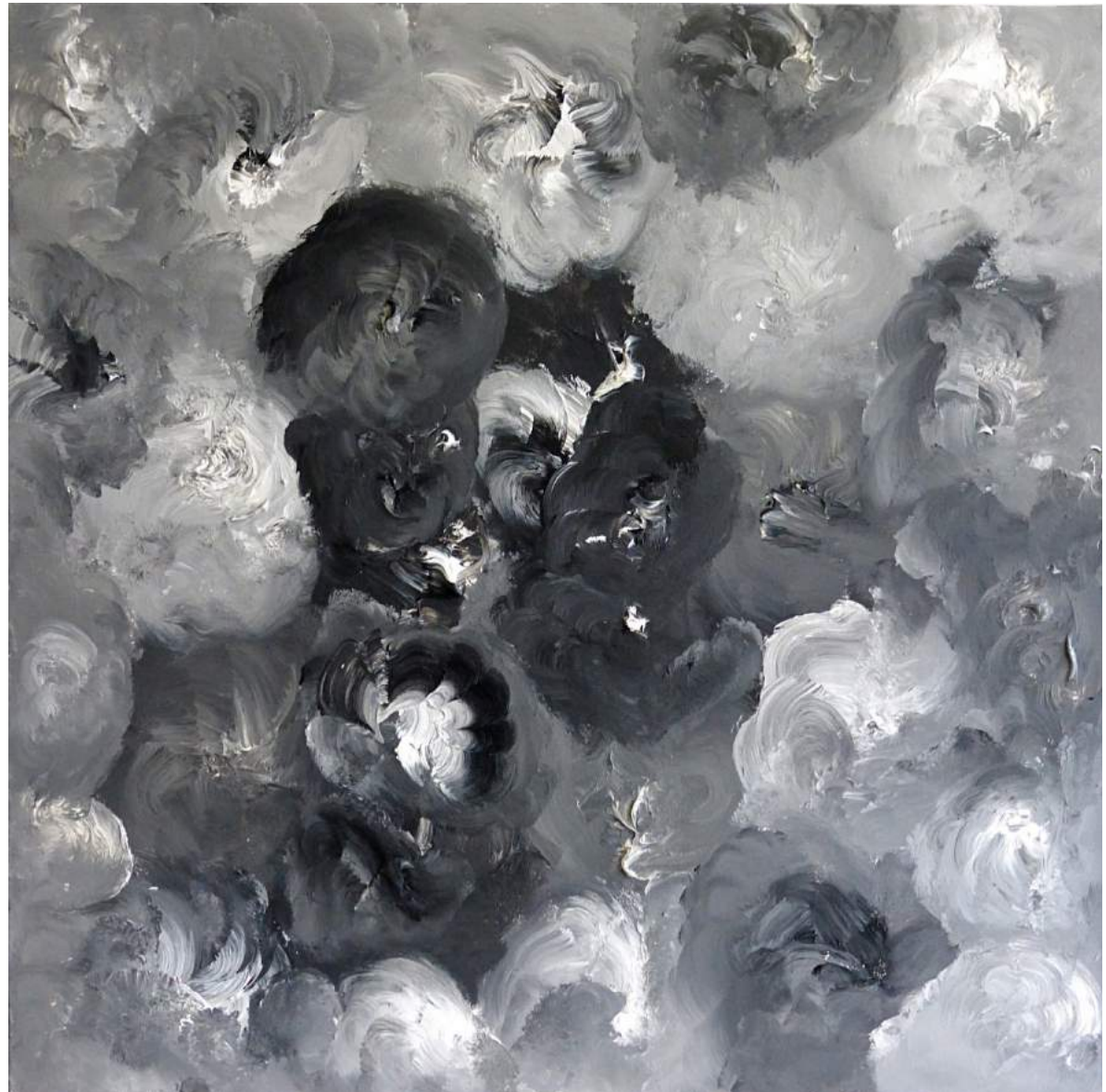
Tanzende Pinsel Schwarz-Grau-Weiß 80 x 80 cm Acryl auf Leinwand