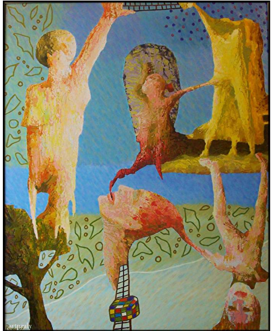
Verbiegung der Freiheit Öl/Lw 80x100 2007