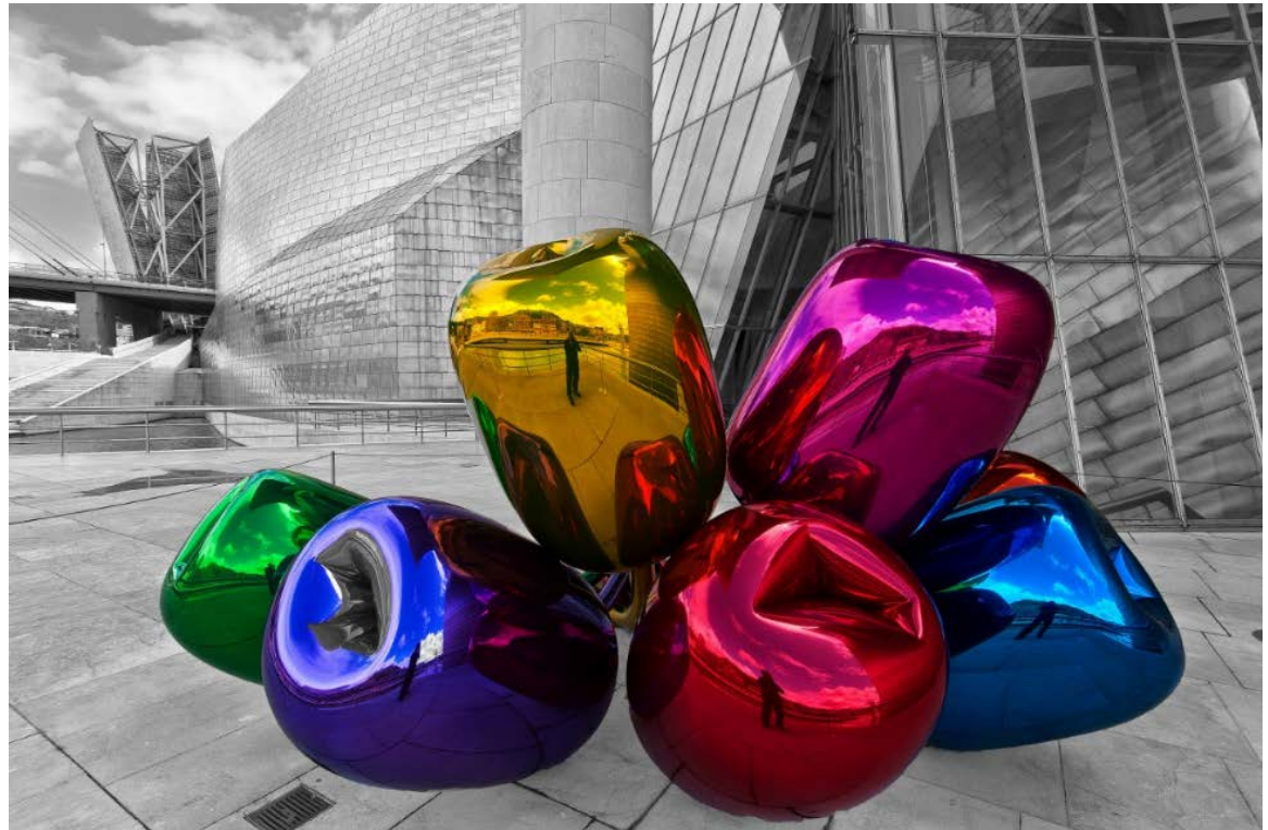
Bilbao Guggenheim Fotodruck auf Leinwand, 60 x 80 2014

Inspiziert durch Henri Cartier-Bresson und Sebastião Salgado gehe ich weltweit meiner Begeisterung für die Fotografie nach. Durch meine langjährige Erfahrung und meine Faszination für Architektur, Landschaften und Menschen habe ich in diesen Motiven neben der Street-Art-Fotografie meinen Schwerpunkt gefunden. Dabei liegen mir die Authentizität, eine eigene Betrachtungsweise sowie die individuelle Interpretation der Motive besonders am Herzen. Ich glaube, dass ein gutes Foto nicht immer nur perfekte Momente oder Menschen zeigt, sondern eine eigene Seele hat. In jedem meiner Bilder steckt eine Geschichte, ein Gedanke oder eine Emotion.