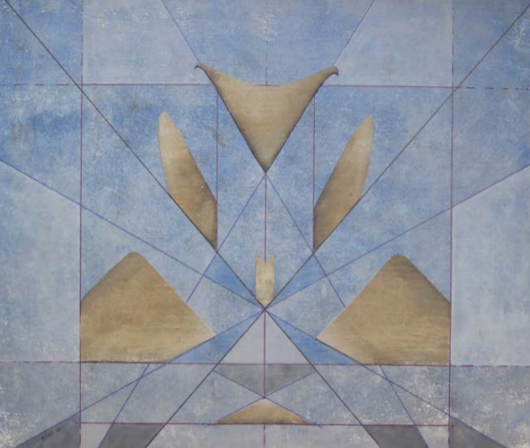
Auseinander Acryl, Lw 50 x 60cm 2016