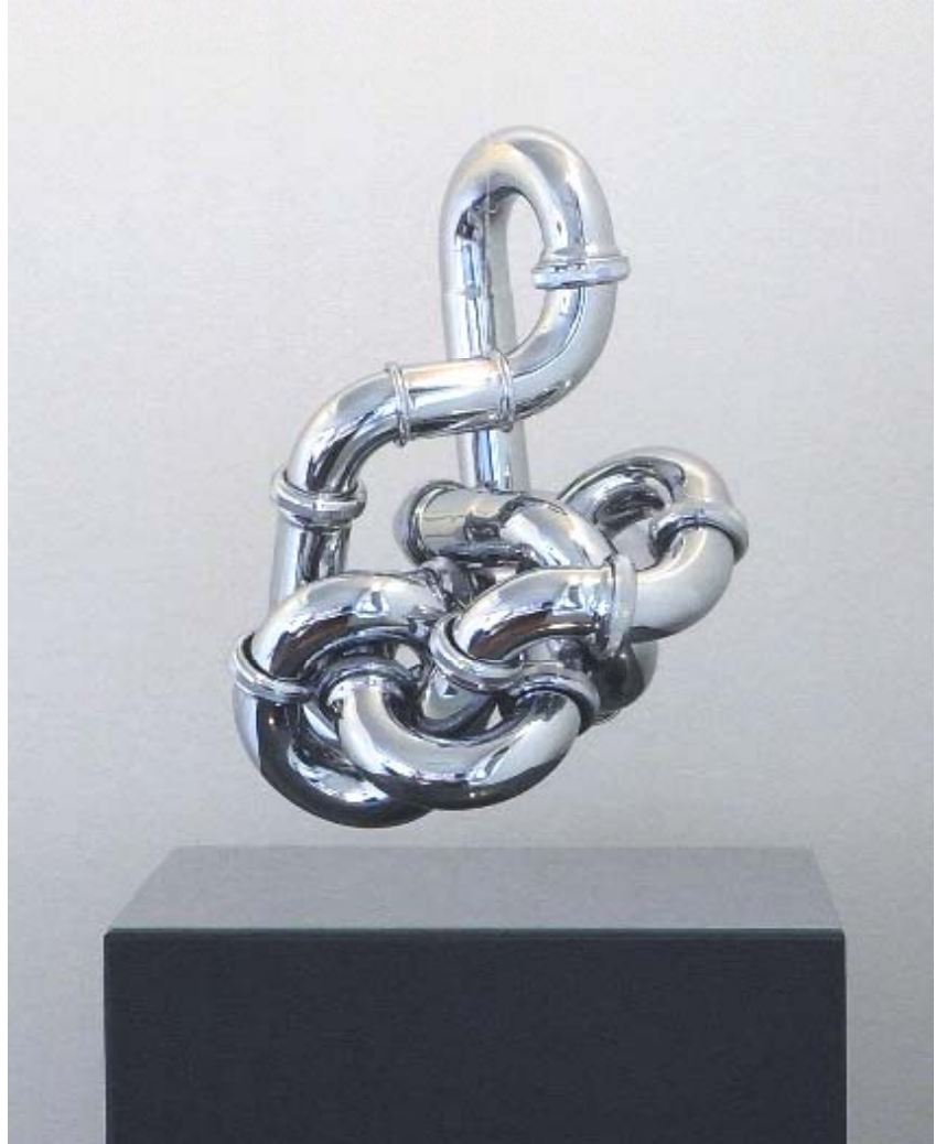
Objekt "Möbius Syphonius"

Jensen ist ein von technischen Möglichkeiten besessener Objektkünstler. Er wählt seine Materialien, seine Fundstücke, im Wortsinn aufgrund ihrer speziellen Aura aus. Es geht um Aufmerksamkeit gegenüber der Sprach der Dinge.