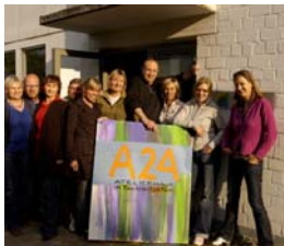
Gruppe zur ersten A24 Galerie- Ausstellung